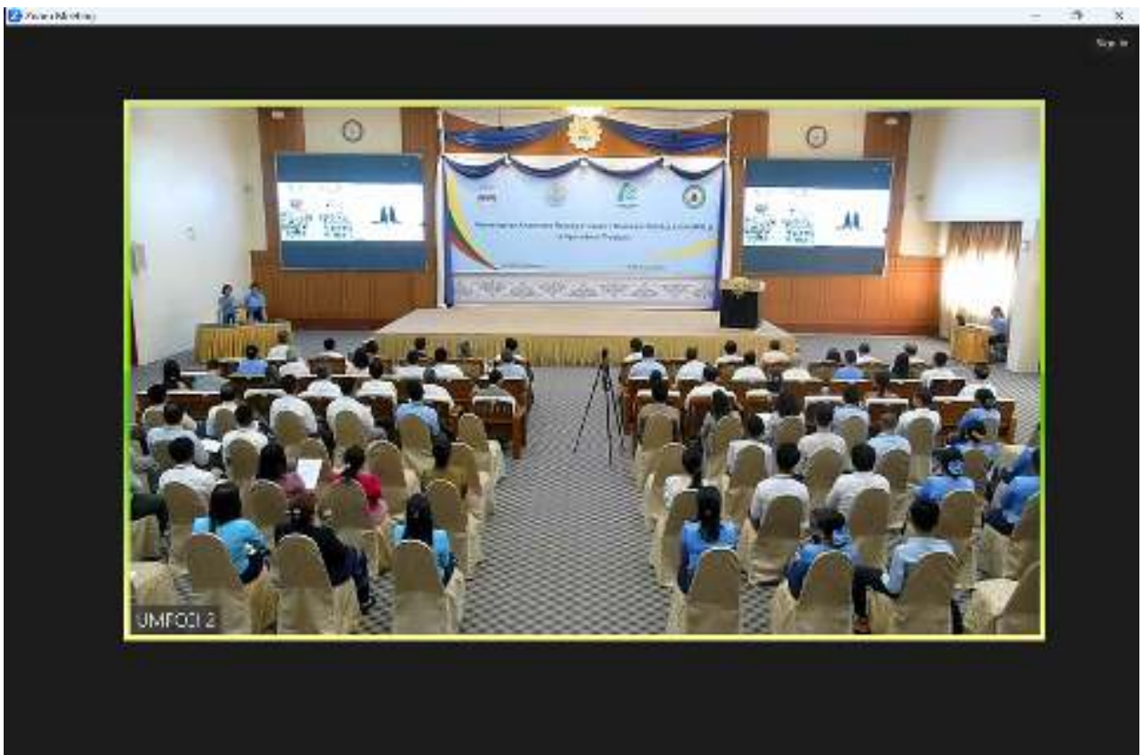
အဆိုပါ ဆွေးနွေးပွဲသည် မြန်မာနိုင်ငံမှ ဂျပန်နိုင်ငံသို့ လယ်ယာထွက်ကုန်များ တင်ပို့ရာ တွင် ဂျပန်နိုင်ငံမှ သတ်မှတ်ထားသည့် စံချိန်စံညွှန်းများ၊ လိုက်နာဆောင်ရွက်ရမည့် နည်းလမ်း